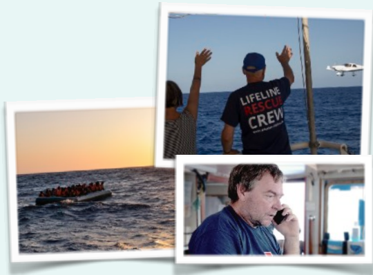
Mission Lifeline im Einsatz für die Rettung von Flüchtlingen in Seenot

Der Jurist Fritz Bauer, Anwalt und Kämpfer für die Menschenrechte, ist eine der spannendsten Persönlichkeiten der Geschichte. Als Kämpfer für Wahrheit und Gerechtigkeit machte er den SS-Mann Adolf Eichmann ausfindig, brachte Auschwitz und die NS-Justiz vor Gericht.